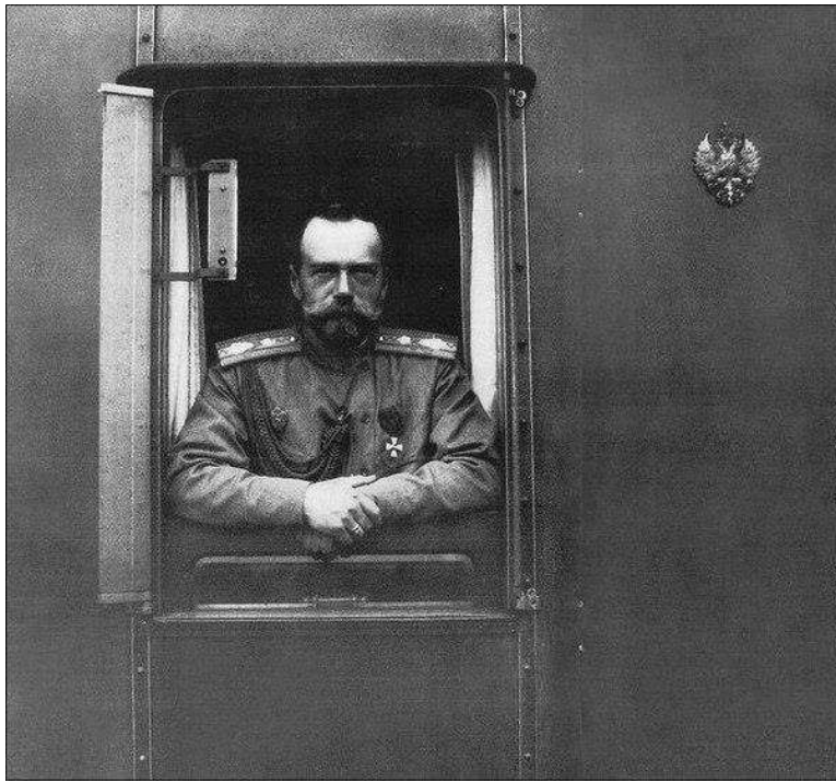
Николай II. Октябрь 1915.

И, наконец, под занавес, может быть, прощальный взгляд на Псков. Дорожные раздумья. 20 октября – как число вряд ли вызывало положительные эмоции. Это день смерти отца – Александра III. Оставалось два года до последнего визита в Псков.