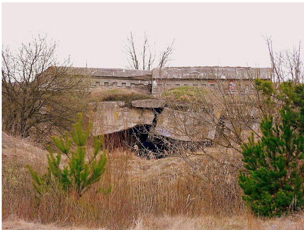
Руины 2-го форта крепости Осовец

Осовецкая крепость в отличие от других русских крепостей - Новогеоргиевска, Ковны, Гродны, выполнила свое предназначение полностью и даже больше чем на нее возлагалось, она закрыла на долгих 6 месяцев доступ противнику к Белостоку, выдержала бомбардировку снарядами мощной германской осадной артиллерии, отразила все мелкие атаки и даже отбила штурм с применением отравляющих газов.