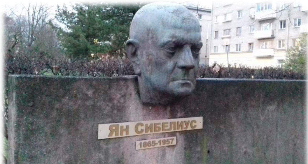
Памятник Яну Сибелиусу.