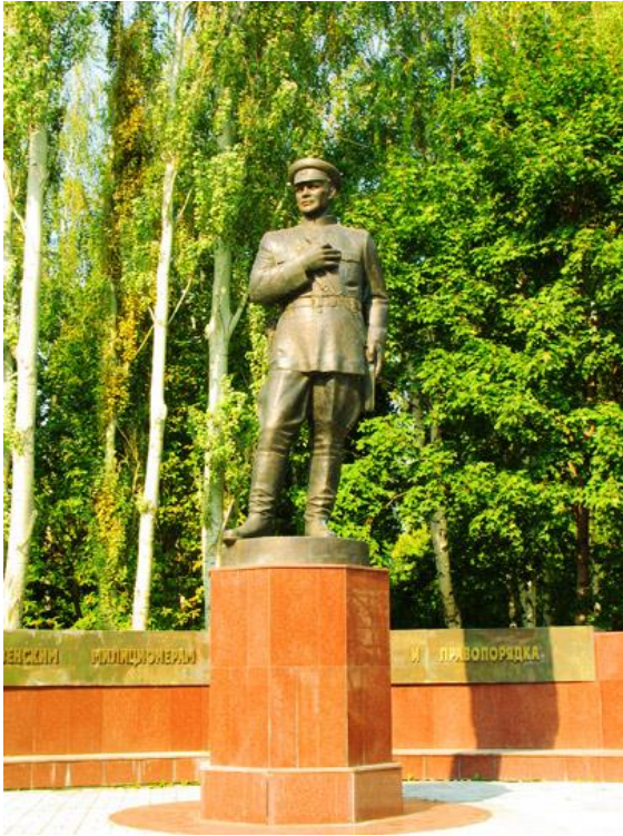
Памятник пензенским милиционерам / Памятник участковому