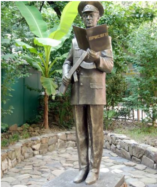
Памятник милиционеру, принимающему присягу в Сочи