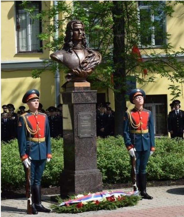
Памятник первому генерал-полицмейстеру Санкт-Петербурга Антону Мануиловичу Девиеру