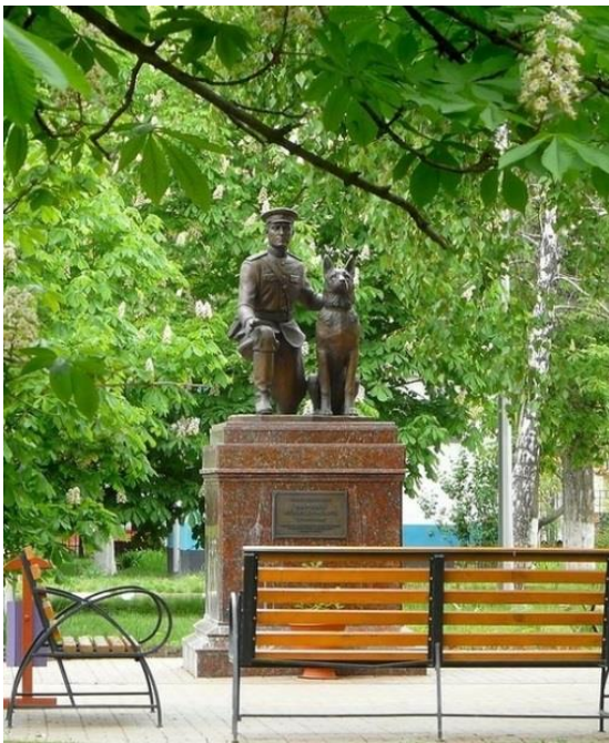
Памятник милиционеру-кинологу Федору Хихлушке и его служебной собаке Лире в Белгороде