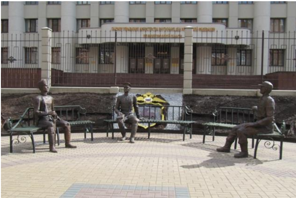
Скульптурная композиция «На страже Закона во все времена» в Нижнем Новгороде

Композиция посвящена 70-летию Победы в Великой Отечественной войне и символизирует преемственность поколений в органах внутренних дел , переданную с помощью воплощения в бронзовых скульптурах представителей профессии трех исторических эпох: городского, милиционера, полицейского.