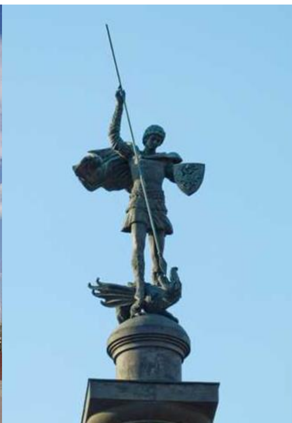
Памятник «Благодарная Россия – солдатам правопорядка, погибшим при исполнении служебного долга» на Трубной площади в Москве