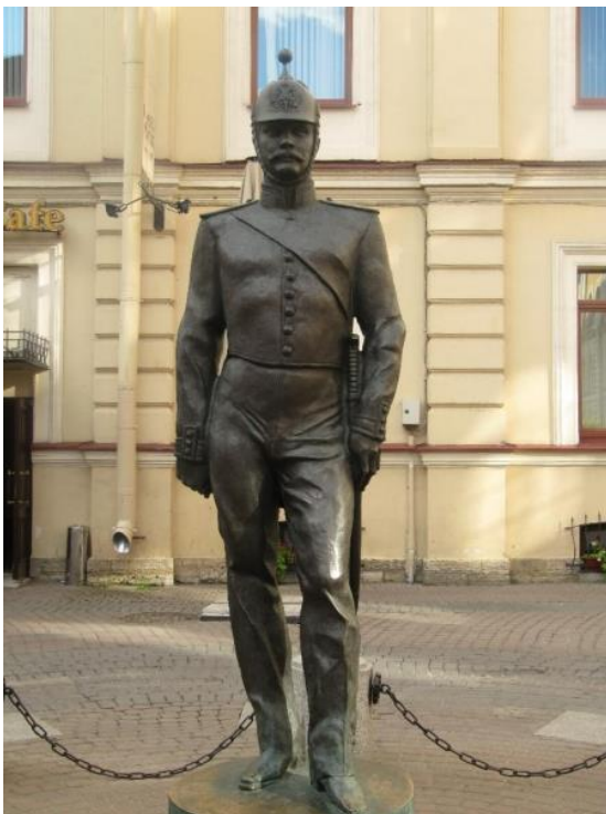
Памятник Городовому в Санкт-Петербурге