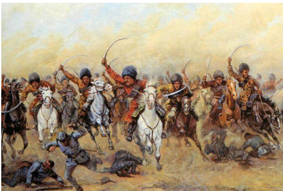
«Атака Дикой дивизии». В. В. Мазуровский, 1916 г.

Дикая дивизия состояла главным образом из добровольцев, ведь по закону Российской империи мусульманское население Кавказа и Средней Азии не подлежало призыву на военную службу. Но это не помешало ей стать одним из уникальнейших воинских подразделений в истории русского военного дела.