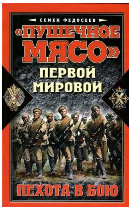
Русская пехота в окопах

«Быть в пехоте во время войны и остаться в живых – это просто чудо...»