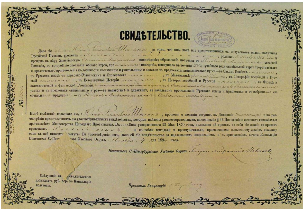
Свидетельство Ю.Р. Штейн, выпускницы Псковской Мариинской женской гимназии, на звание домашней учительницы. 4 ноября 1886 г. ГАПО. Ф. 7. Оп. 1. Д. 219. Л. 11.