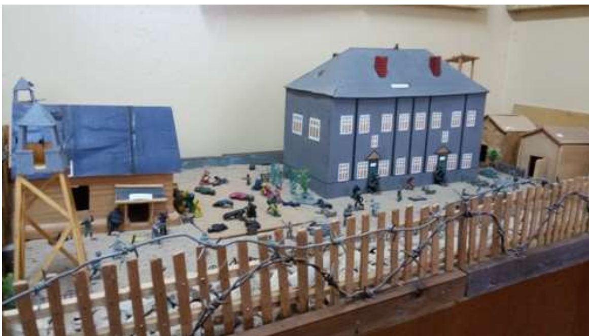
Макет Моглинского лагеря.

В книге на основе ранее не вводившихся в научный оборот архивных документов рассказывается об истории одного из региональных концлагерей, – Моглинского концлагеря, располагавшегося недалеко от Пскова в зоне ответственности «Эстонской полиции безопасности и СД».