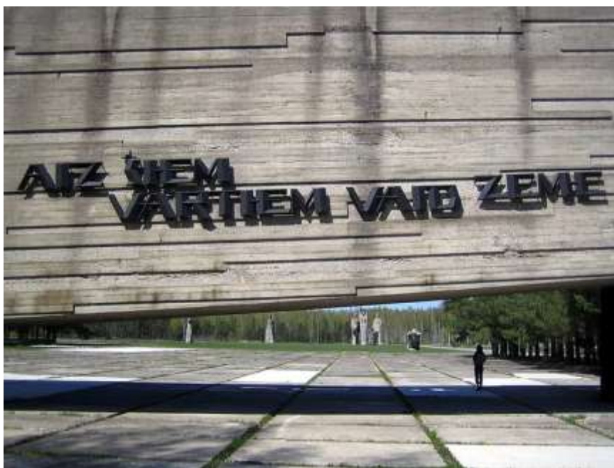
Мемориальный комплекс «Саласпилс». Надпись на латышском при входе: «За этими воротами стонет земля».