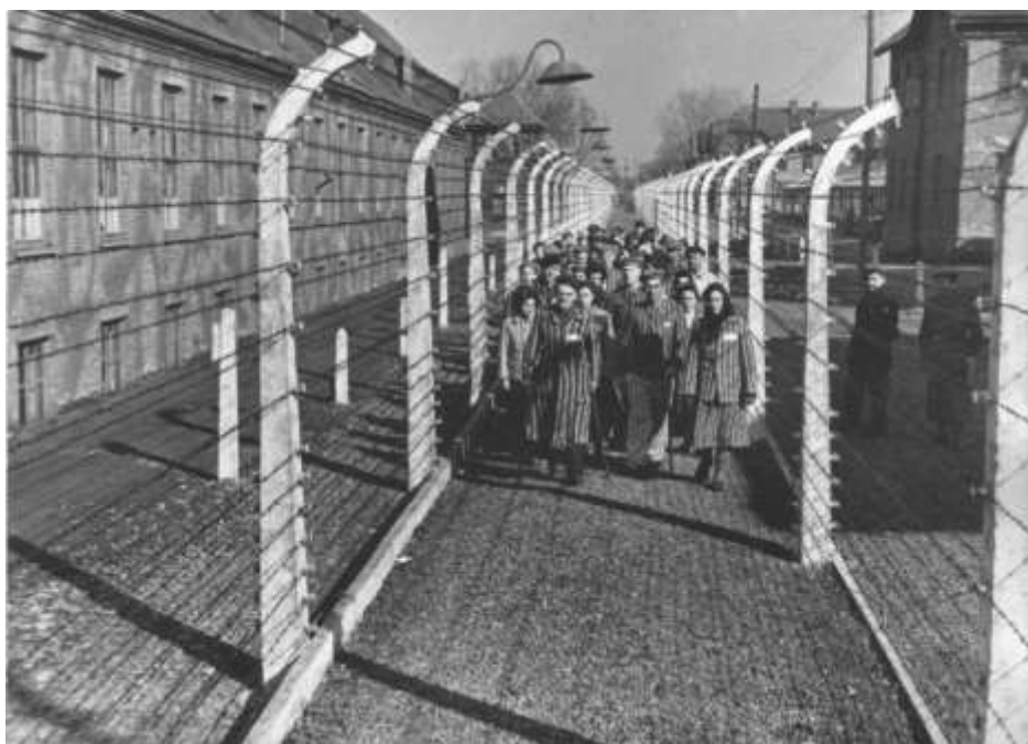
Группа узников и узниц концлагеря Освенцим у колючей проволоки после освобождения