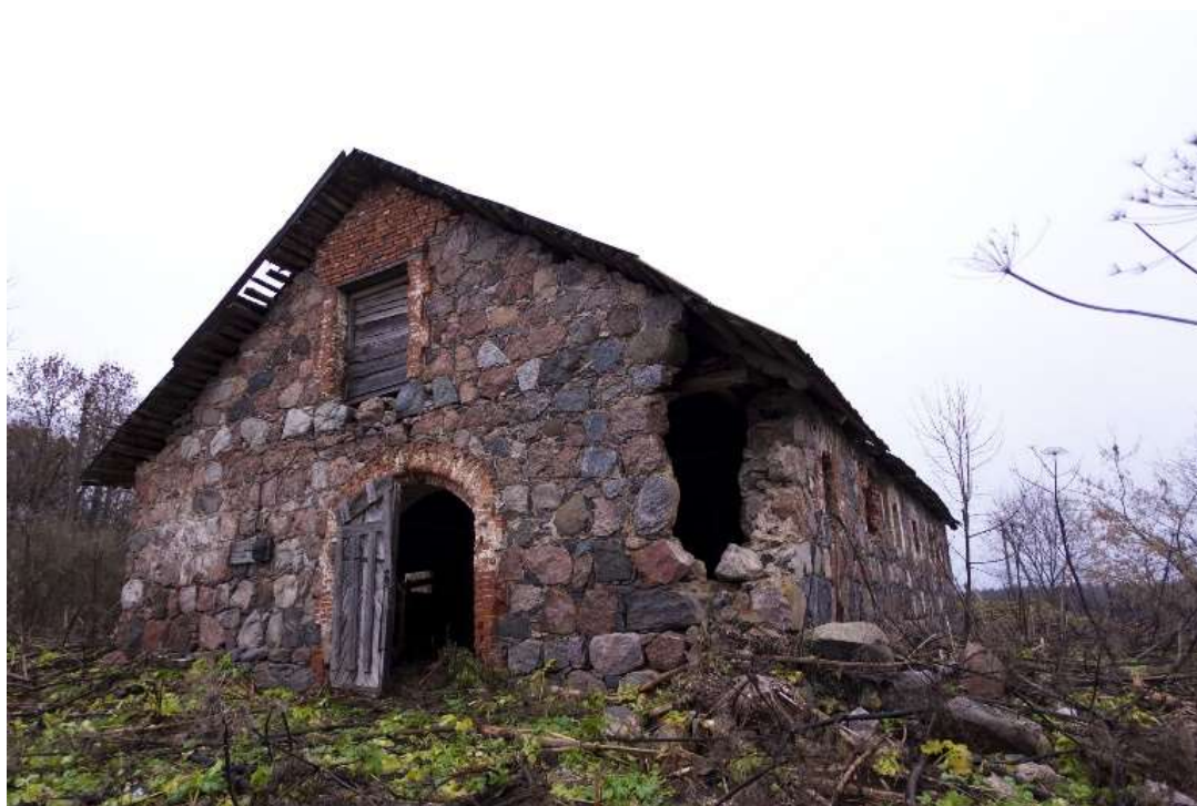
Быстрецово. Руины хозяйственной постройки.