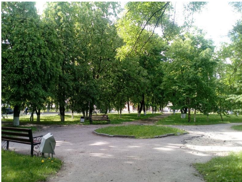
Сквер на пересечении улиц Леона Поземского, Труда и Волкова в г. Пскове

В 2009 году – в год 15-летия со дня начала работы Псковского областного Собрания депутатов, 15 депутатов Собрания и члены аппарата приняли участие в посадке первых деревьев аллеи Парламентаризма. Аллея была заложена в сквере, расположенном на пересечении улиц Леона Поземского, Труда и Волкова, за церковью Козьмы и Дамиана с Примостья.