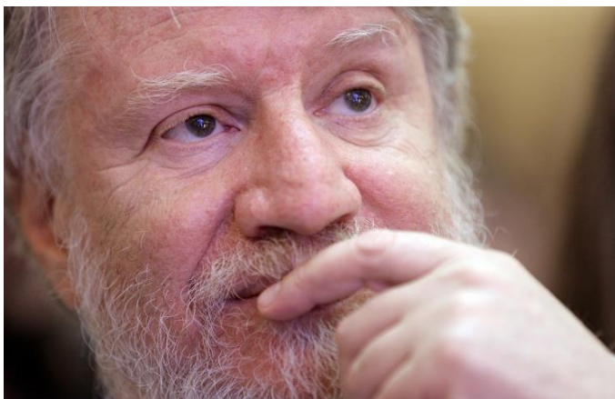
Владимир Шаров

Обладателем престижной литературной премии стал историк, эссеист Владимир Шаров.