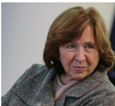
Писательница Светлана Алексиевич