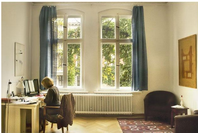
За письменным столом в Берлине, 2011 год.

Книги Алексиевич переведены на 30 языков мира. Ими зачитывается не только бывший Советский Союз, зачитывается вся Европа.