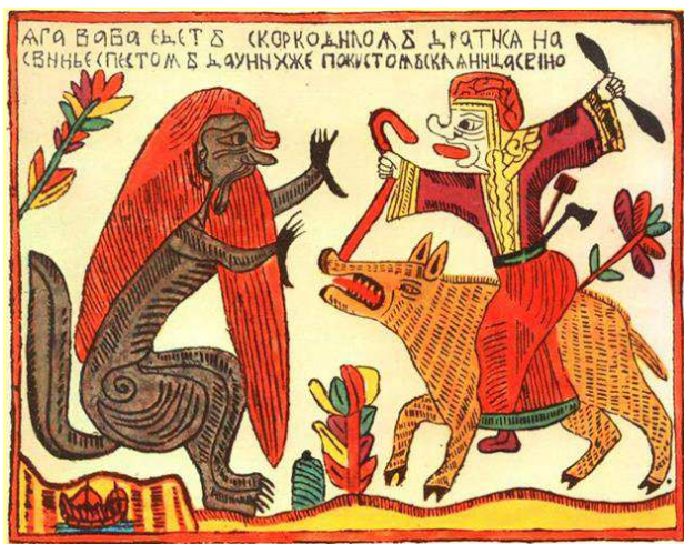
Крокодил и Баба Яга. Старинный лубок.

– Движенья нѣтъ, – сказала мудрецъ брадатый. Сие азъ опровергну въ тотъ же мигъ: Бѣжитъ, такъ значитъ, движется куда-то По улицамъ комаринскій мужикъ! 16