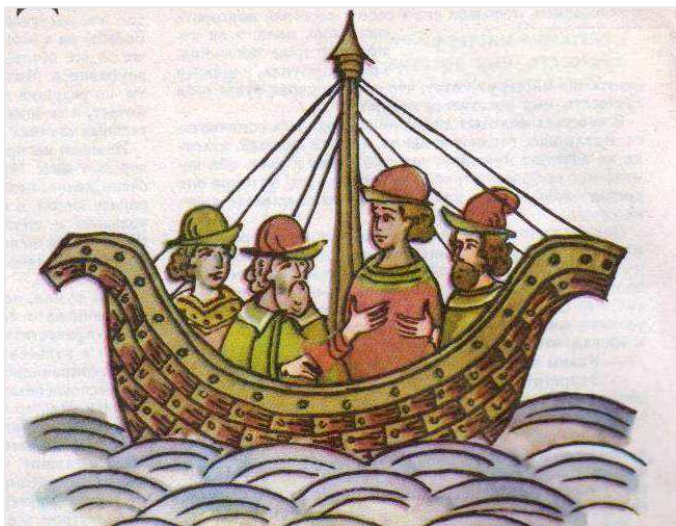
Гости. Рис. Г. Комарова по древнерусским миниатюрам.

5 – физиологические особенности крокодила не дают ему ни малейшей возможности пережить русскую зиму – даже в состоянии анабиоза, то есть, в спячке; и беглецы сгинули, и сама единичность упоминания о таком событии говорит в пользу его достоверности (Сапуновы). А поскольку псковские летописи были хорошо знакомы новгородцам, эта запись породила (новгородскую) легенду о крокодиле-оборотне (Коваленко, Смирнов).