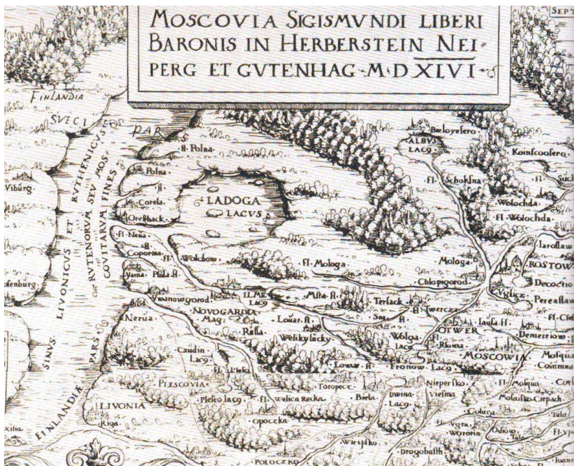
Фрагмент карты 1546 года к «Запискам о Московии» С. фон Герберштейна.

Почему же к концу XVI в. эти внушительные реликтовые прессыкающиеся предприняли исход на запад, юго-запад? Для исторического географа, знакомого с изменениями климата в XV-XVI вв., эта загадка не представляется неразрешимой.