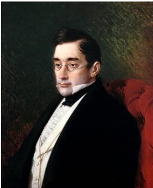
Портрет Александра Грибоедова. И. Крамской. 1873

15 января исполнилось 220 лет со дня рождения А. С. Грибоедова - самого непонятого и загадочного персонажа "Золотого века" русской литературы.