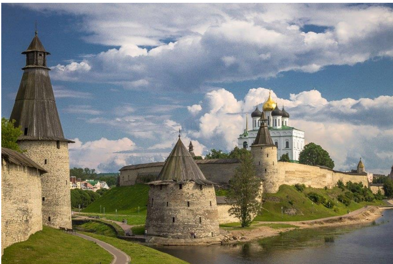
Псковский Кремль.

Библиографические записи статей из псковских газет – результат участия с 2009 года муниципальных библиотек Централизованной библиотечной системы города Пскова в корпоративном проекте Псковской областной универсальной научной библиотеки Сводный каталог региональных периодических изданий .