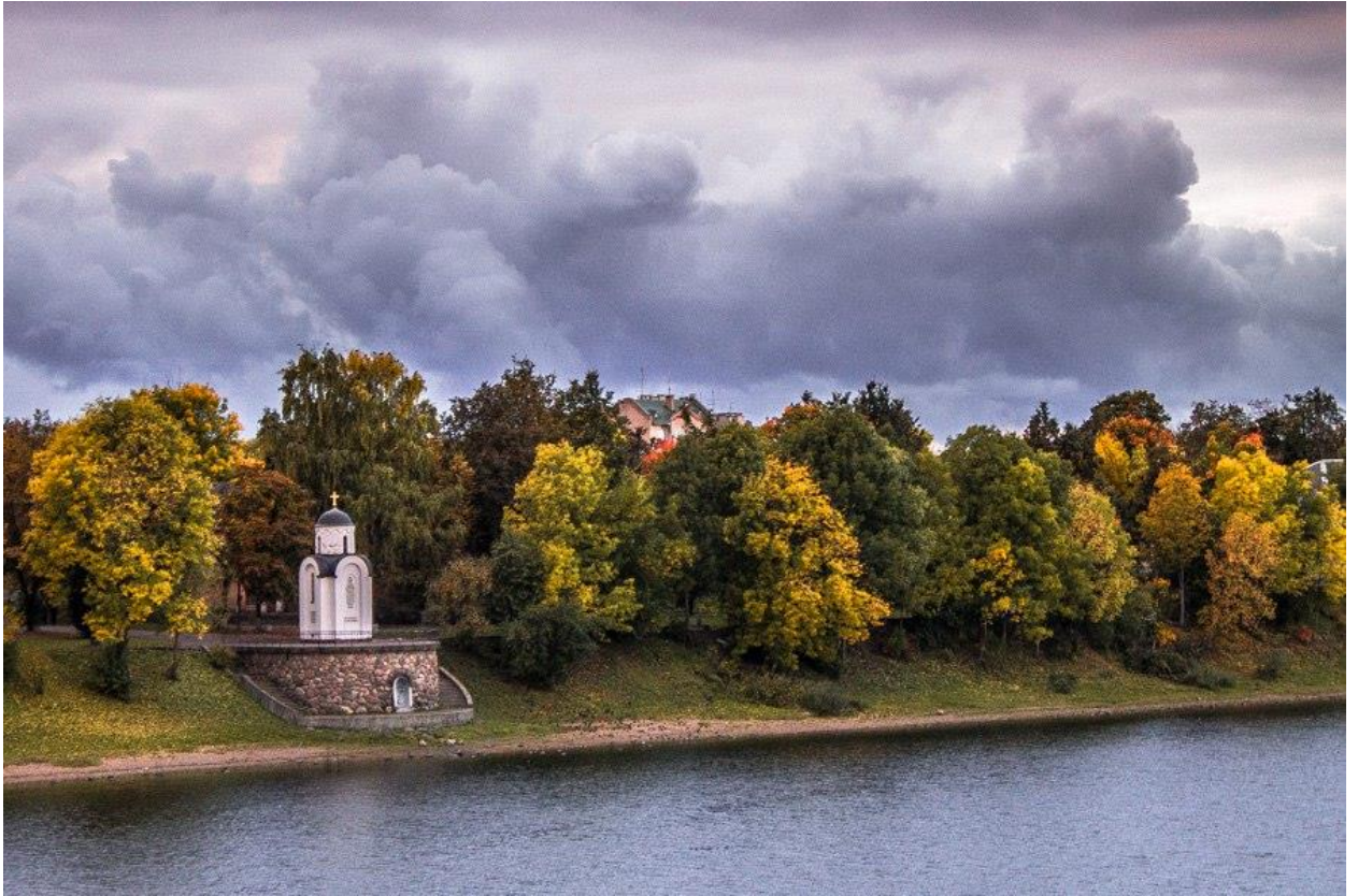
Псков. Ольгинская часовня.

Автор фотографий Анна Камнева - участник Открытого международного фестиваля мультимедийных фотоинсталляций «Цвет белой стены» и Фестиваля современного искусства «Art stream», которые ежегодно проходят в Пскове.