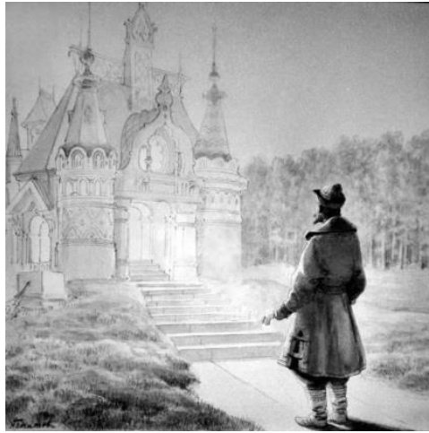
Иллюстрация Н. А. Богатова

Известна также цветная лаковая миниатюра «Аленький цветочек» за авторством Народного художника Российской Федерации Липицкого Виктора Дмитриевича - художника Федоскинской миниатюрной живописи (1921–1994), которая встречается в росписи шкатулок: